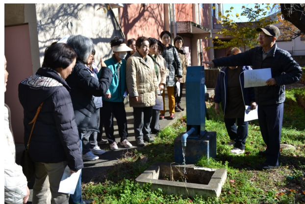
生活用井戸の説明を真剣に聞く参加者の皆さん

最後に書いてもらったアンケートでは、これからの運営に向けた意見も多く見られ、参加者の皆さんの意識の高さが感じられました。