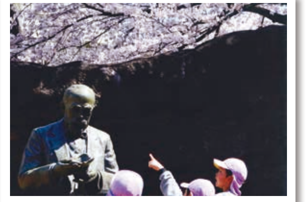
入選 井上英子「モース博士に話しかける子供達」 大森貝塚遺跡庭園