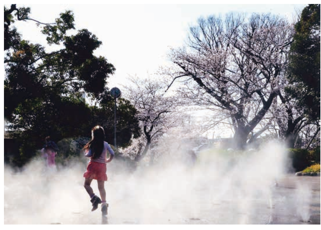
公園フォト大賞 池田良二「花がすみ」 大森貝塚遺跡庭園 (大井6-21)