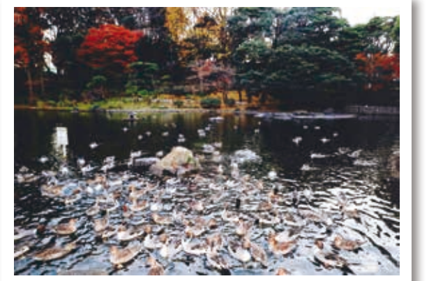
入選 青柳昭治「回遊池に遊ぶ鴨」 戸越公園