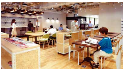
品川産業支援交流施設 (SHIP)

【都市型産業を推進する技術力向上支援/産学公連携の推進/ものづくり次世代人材育成支援/新市場開拓に向けた販路拡大支援、アジア地域等への海外進出支援/品川産業支援交流施設の運営】