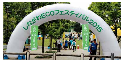
しながわECOフェスティバル

【しながわECOフェスティバルの充実／中小規模事業所の省エネ推進支援事業の充実】