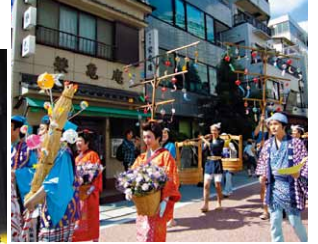
しながわ宿場まつり