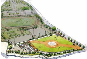
しながわ中央公園拡張整備

ヘリポート機能を持つ防災拠点の完成 木密地域不燃化10年プロジェクト促進支援 木密解消に向けた総合的な連携強化 感震ブレイカー設置の普及促進 「しながわ防災学校」開校、「しながわ防災体験館」リニューアルオープン