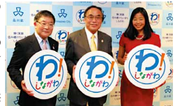
“わ！しながわ”キャンペーン

【意見交換が活発になるしくみづくり／区民とともに情報発信の充実、情報要支援者のための情報提供の充実、シティプロモーションの推進／区政資料の収集と情報提供の充実、区政・地域情報の発信と活用／公共サインの設置推進】