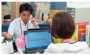
支え愛ほっとステーション(大崎第二地区)

【(仮称)ふれあいステーション事業の充実／孤立死防止など地域での見守り体制のしくみづくり、ふれあいサポート活動((仮称)支え愛活動)の推進／ほっとサロンの拠点整備／成年後見センター事業の充実／要配慮者支援体制の整備】