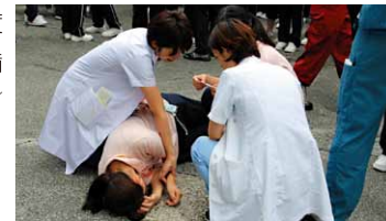
医療救護訓練（昭和大学病院）

【かかりつけ医・歯科医・薬局制度の促進、医療安全支援体制の整備／休日・夜間の医療体制の充実／医療機関等との連携の推進】