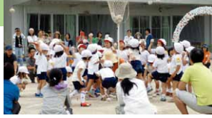
運動会の様子(二葉すこやか園)