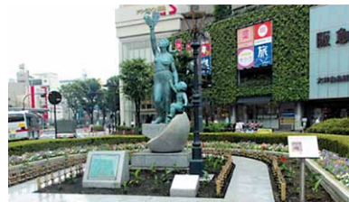
しながわ平和の花壇