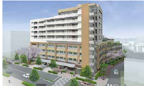
平塚橋高齢者複合施設

特別養護老人ホームの整備 (仮称)ふれあいステーション事業の拡充 認知症対策プロジェクト「くるみぶらん」の推進