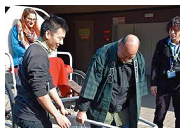
外国人と学ぶしながわ新名所（旧東海道）

【子ども・若者育成支援／青少年の社会体験活動支援、体験活動の支援・機会の提供／ティーンズプラザの充実】