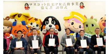
マスコット防犯PR活動事業

【地域住民が主体となった防犯対策の強化、官民一体となった防犯対策と意識啓発の推進／客引き行為等防止の推進／子どもを見守る地域ネットワークの拡充】