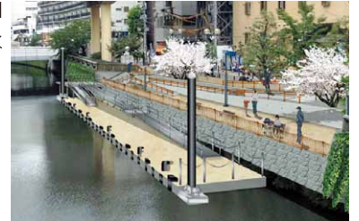
五反田リバーステーションの整備イメージ

【水辺空間の整備促進、五反田リバーステーション整備／水辺空間の利活用促進／目黒川・立会川・勝島運河の水質改善】