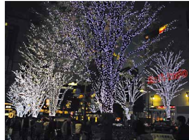
大井町駅イルミネーション