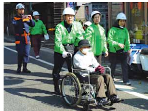
避難誘導ワークショップ