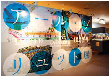
アール・プリュット展