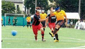
ブラインドサッカーフェスタ

トップスポーツ&障害者スポーツを体験しよう わ!しながわ オリンピック・パラリンピック教育プラン 品川区都市型観光プランの推進 シティプロモーションの推進