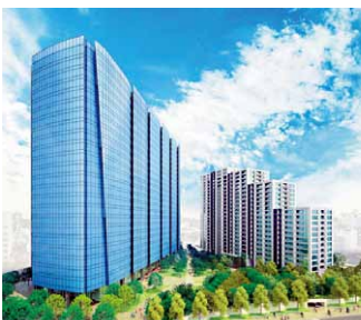
再開発事業（西品川一丁目地区）

【大井町駅周辺地区の整備促進、大井一丁目南第1地区・大井町駅西口E地区・広町地区の整備、大崎駅周辺地区の整備促進、大崎三丁目地区・西品川一丁目地区・大崎西口駅前地区の整備、五反田駅周辺地区・品川駅南地域周辺地区の整備促進、目黒駅前地区の整備、品川シーサイド駅周辺地区の整備促進／武蔵小山駅周辺地区の整備促進、武蔵小山駅前通り地区・武蔵小山パルム駅前地区・小山三丁目第1地区の整備／地域によるまちの自主的な管理運営の支援、区民の自主的なまちづくりの支援】