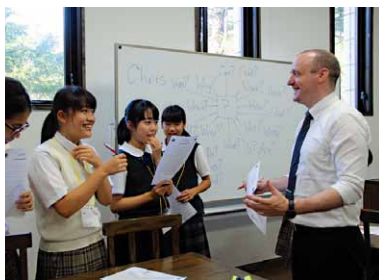
イングリッシュキャンプ

【小中一貫教育の実践／特別支援学級の開設・教育活動の充実／教員の区独自採用の推進、外部評価制度による学校経営力の強化／いじめ等の対策強化／学校図書館の活用】