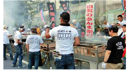
目黒のさんま祭り