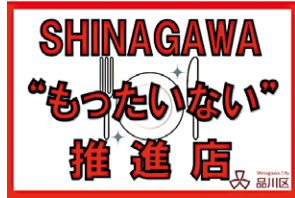
「SHINAGAWA "もったいない" 推進店」ステッカー