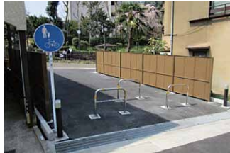
不燃化の促進（避難通路の整備）

【「東中延1・2丁目、中延2・3丁目地区、旗の台・中延地区、二葉3・4丁目、西大井6丁目地区、豊町4・5・6丁目地区、西品川2・3丁目地区、大井5・7丁目、西大井2・3・4丁目地区密集住宅市街地の整備促進」、感震プレーカー設置の普及促進／木造住宅等の耐震化支援、耐震化アドバイザーの派遣／「補助26号線その2地区、戸越公園一帯周辺地区都市防災不燃化の促進」、「荏原北・西五反田地区、戸越・豊町地区防災生活圏促進事業の推進」、滝王子通り地区避難道路機能の強化、特定整備路線（補助29号線・放射2号線・補助28号線）沿道不燃化の促進、橋梁の長寿命化の推進、安全な避難路等の確保／雨水流出口抑制対策の推進、排水施設の新設、防水板の普及促進、崖・擁壁の安全化対策の促進】