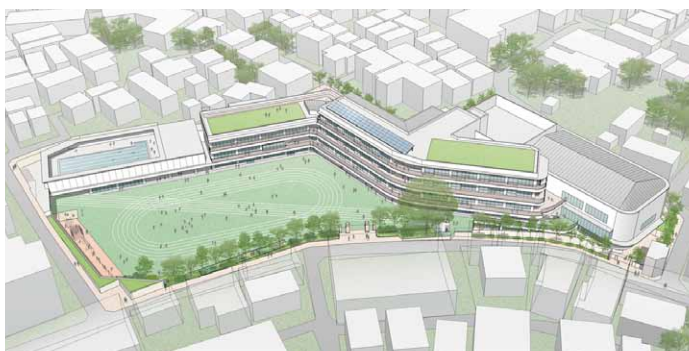
芳水小学校の改築