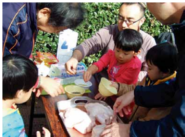
父親の子育て参加促進事業（八潮児童センター）

【親育ちサポート事業の充実、「家族いっしょに楽しいごはん」運動の推進／健やか親子支援事業の充実、すくすく赤ちゃん訪問事業の推進】