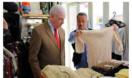
「英語少し通じます商店街」プロジェクト

【外国人の暮らしの支援事業の実施、国際都市・品川区をめざした庁内体制づくり/地域住民と外国人との交流促進/地域の国際化への対応力の向上】