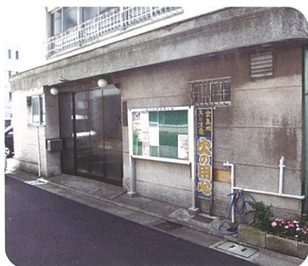
町会会館建設などに助成します

品川区は町会・自治会の自主性・主体性を尊重し、町会・自治会の活動の活性化を推進するために、加入促進活動への支援をはじめ、活動や運営に関する支援策を積極的に推進します。