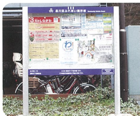
毎月、区の情報統合ポスター(掲示板)と統合チラシ(回覧板)でお知らせします