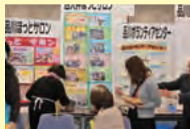
西大井ほっと♥サロン

来場者が多く活気があって良いと思います。前夜祭の参加者も増えるようにPRしたいと思います。