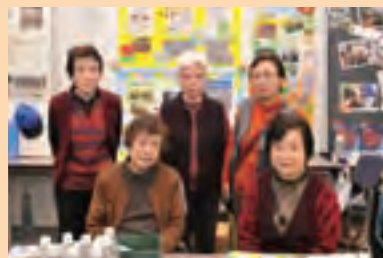
品川区母子寡婦福祉連合会