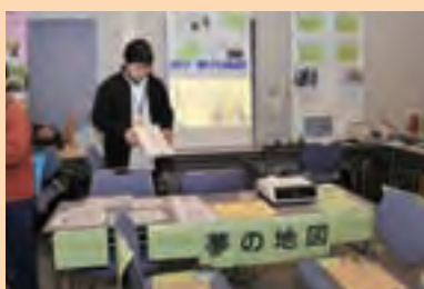
NPO 法人 夢の地図