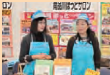
南品川ほっと♥サロン

一般区民の参加者が多く、昨年に比べ活動PRの効果は高かった。他団体との交流も持てて良かった。