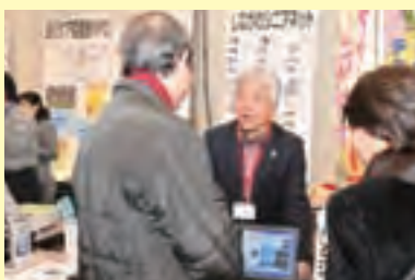
しながらわシニアネット