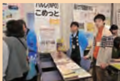
NPO 法人 パルレ、こめっと

ゆるキャラが会場の雰囲気を和ませてくれて良かった。ボードゲームが盛り上がりました。