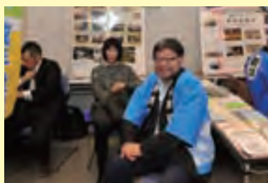
NPO 法人 教育サポートセンター NIRE