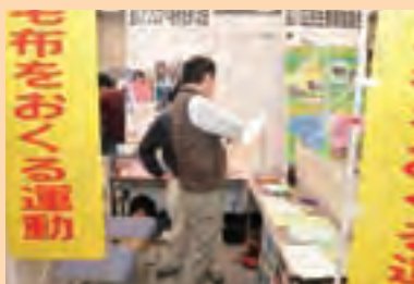
品川アフリカへ毛布をおくる会

来場者が多く活気があって良いと思います。前夜祭の参加者も増えるようにPRしたいと思います。