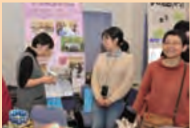
NPO 法人 品川女性起業家交流会 ーしな job