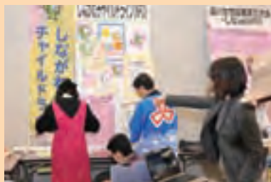
NPO 法人 しながわチャイルドライン

多くの方が見えてくださり、チャイルドラインを理解していただける良い機会になりました。