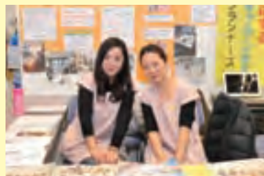
(一社)ドゥーラ協会(産後ドゥーラ)

今回初出展!区で活動する他団体と交流でき、活動内容を知ることが出来て大変勉強になりました。