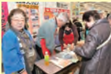
荏原ほっと♥サロン