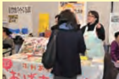
NPO 法人ふれあいの家 —おばちゃんち