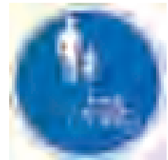
自転車および歩行者専用標識