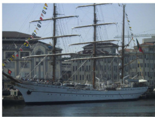
ポルトガルハウス