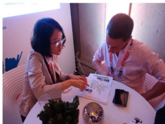
ブリティッシュハウスにてロンドン市職員にヒアリング

ブラジルハウスは、コパカバーナ海岸通り沿いの大きな倉庫を改装して設置されており、誰でも自由に入場することが可能で、しかも観光客向けに配慮された内容になっており、ブラジルの文化、自然、ビジネスなどが中心のハウスでした。オリンピック・パラリンピック関係の展示紹介では、車いすバスケットボールの体験会の実施をはじめ各種ワークショップを中心に展開され、非常に人気があるハウスで、入場には長蛇の列ができていました。