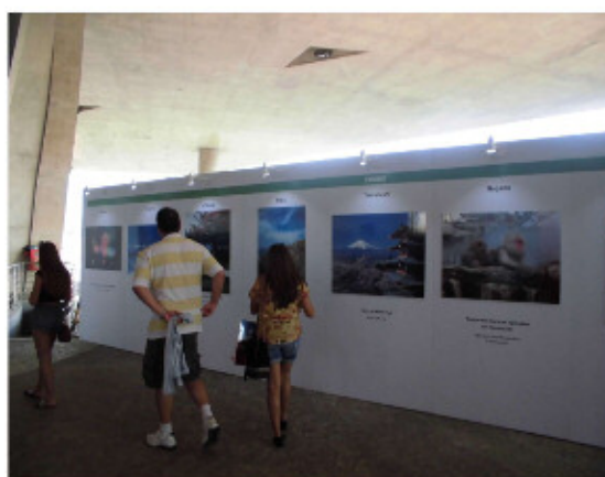
ジャパンハウス＝観光地の展示

1階の展示会場では、日本各地の観光スポットの写真と各観光地の案内チラシが設置され、特に、東京都の紹介コーナーでは、リオ大会に出場する日本代表選手全員の写真を大きくパネル化して展示したり、代表選手のユニホームや選手への応援メッセージが書かれ紹介されており、日本選手の活躍を期待する姿勢が示されていました。また、新国立競技場のジオラマには人々が集まり、さらに、1000体を超えるひな人形の展示や、日本食の寿司や焼き鳥などの提供と日本酒の試飲などの食を含めた日本食文化をアピールするなど、大変盛況であ