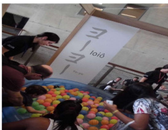
ヨーヨーのワークショップ