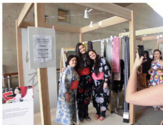
浴衣の着付けワークショップ