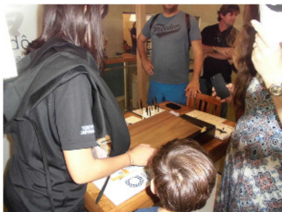
書道のワークショップ

2階には、版画、ヨーヨー、書道、浴衣や茶道のワークショップも行われており、外国人の人々は日本文化に興味と関心を持って体験していました。