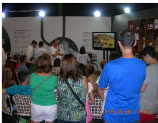
ブラジルハウス=ワークショップ

ブラジルハウスは、コパカバーナ海岸通り沿いの大きな倉庫を改装して設置されており、誰でも自由に入場することが可能で、しかも観光客向けに配慮された内容になっており、ブラジルの文化、自然、ビジネスなどが中心のハウスでした。オリンピック・パラリンピック関係の展示紹介では、車いすバスケットボールの体験会の実施をはじめ各種ワークショップを中心に展開され、非常に人気があるハウスで、入場には長蛇の列ができていました。