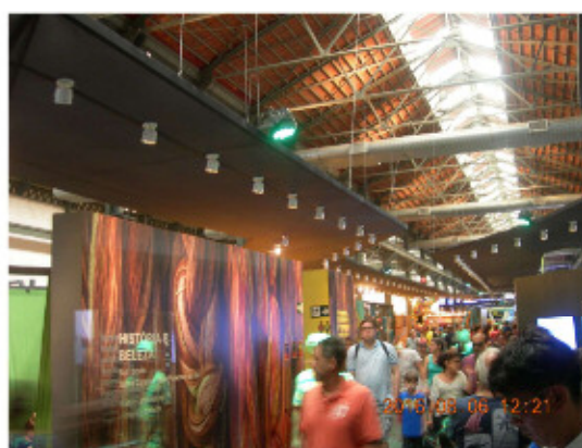
ブラジルハウス=展示ブース