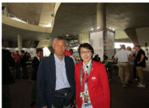
ジャパンハウス＝橋本聖子リオ競技大会選手団団長