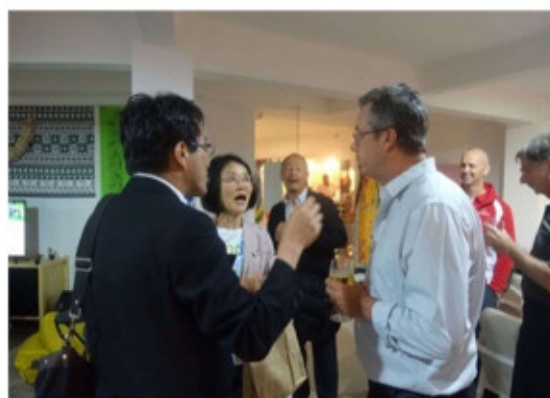
オセアニアハウス＝事前キャンプ誘致の説明