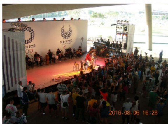
ジャパンハウス＝セレモニー

1階のイベント会場では、連日様々な催しを実施され、日本の伝統芸能である和太鼓が披露された他、リオのサンバやブラジルのアーティスト、東京観光セミナー、トークショー、日本食のシンポジウムなど様々なステージが行われているとのことでした。