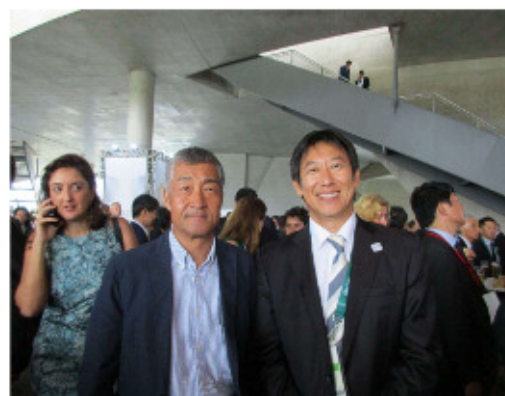
ジャパンハウス＝鈴木大地スポーツ庁長官