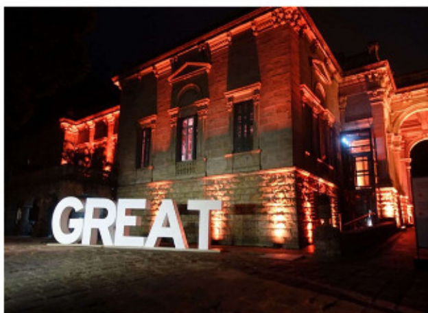
ブリティッシュハウス

ホスピタリティハウスは、世界各国からオリンピック開催都市に集まる多くの観光客をはじめ官民のスポーツ関係者や多種多様な企業等が自らを世界に向けて情報発信・PRする絶好の機会であり、どのホスピタリティハウスもかなりの経費を投入し、力を入れて取り組んでいると感じました。