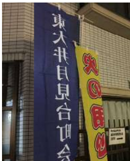
町会旗と火の用心旗

歳末特別警戒「火の用心」を平成28年12月27日(火)・28日(水)に実施しました。以前は3日間行っていた行事ですが、年末に帰省等でご不在の方も多くなり、現在は2日間の実施となっています。