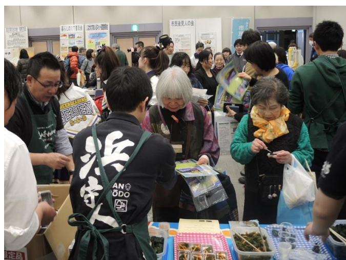
7階イベントホール。今年も多くの方が来場されました