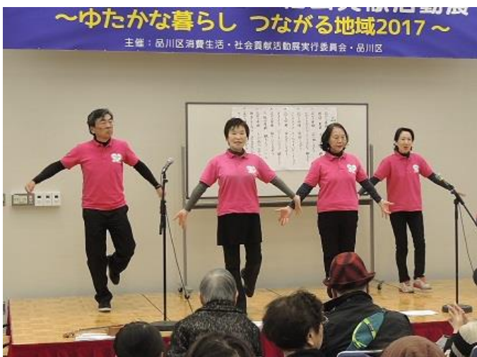
健康大学しながわ企画運営委員会によるステージ