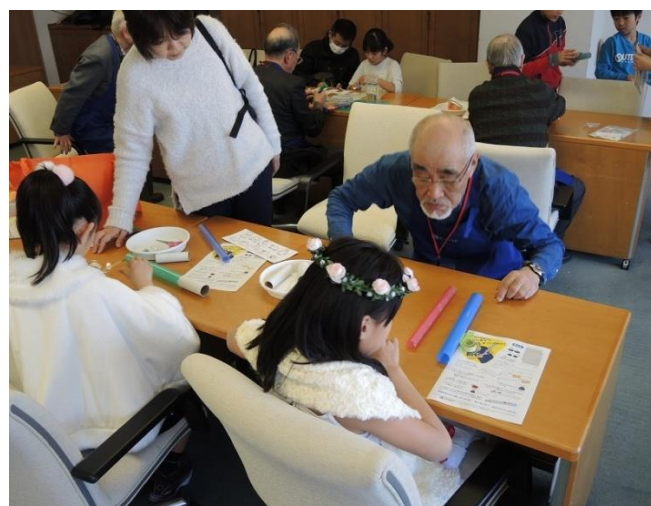
子どもたちでにぎわうものづくり教室(コアネット)

2017年2月11日(土・祝)・12日(日)、大井町「きゅりあん」にて、品川区消費生活・社会貢献活動展が開催されました。消費者団体と社会貢献団体の垣根を越えて、多岐にわたる分野の団体が集合。お互いに交流を深めるとと