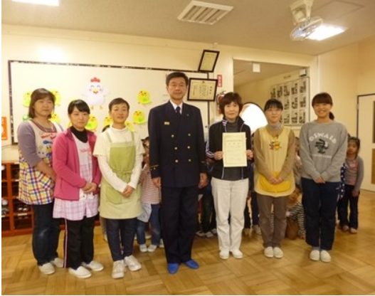
合格証を手にした小山台保育園園長と先生たち

大地震などの不測の事態に備え、事業所の防災力を高める「自衛消防力検定」が、1月24日に小山台保育園で行われました。 この検定は、木造住宅などが密集する荏原地区の地域特性を踏まえ、3年前から荏原消防署が独自に、事業所を対象に行っているものです。災害発生時に消火活動や避難誘導、また応急救助など、消防隊が到着する間にできる限りの確な活動を行い、現場の被害を最小限にとどめるための防炎行動力の向上を目的としています。