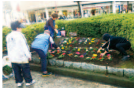
みどりと花のボランティア

公園などの清掃や花壇の手入れをしていただく「みどりと花のボランティア」を募集しています。区内在住か在勤の3人以上の団体が1年以上継続して活動していただける方の連絡をお待ちしています。 活動に必要な道具の一部は区で用意します。 花苗などを購入する費用の助成制度があります。