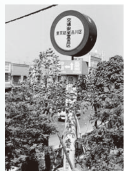
第二京浜国道傍らの交通安全区宣言塔（昭和42年）