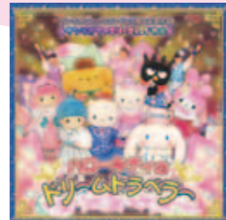
©'76, '93, '96, '99, '01, '17 SANRIO CO., LTD. APPROVAL No. SP580039

ふわふわ遊具・ミニボウリングゲーム（無料）、万華鏡づくり・ペーパークラフト教室（有料・定員あり）などを体験できます。詳しくはお問い合わせください。 時間/午前11時～午後2時 会場/イベントホール（きゅりあん7階）