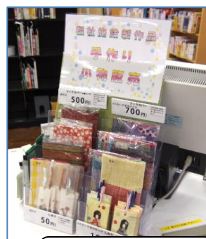
手作りしおりブックカバーの販売

今年1月より品川区内の社会福祉法人で作られた手作りのしおり、ブックカバーが受託販売されています。値段も手ごろで、素敵な作品が揃っていました。貸出カウンターの近くに販売コーナーがありますので、是非手に取ってみてください。 大井図書館では、毎週水曜日15時から小学生以下を対象にした、職員の方とボランティアによるお話し会が開催されています。また最近では0〜2歳の赤ちゃん向けのお話し会も開催されています。お母さんたちの交流の場にもなっているそうですので、興味のある方は参加されてはいかがでしょうか?