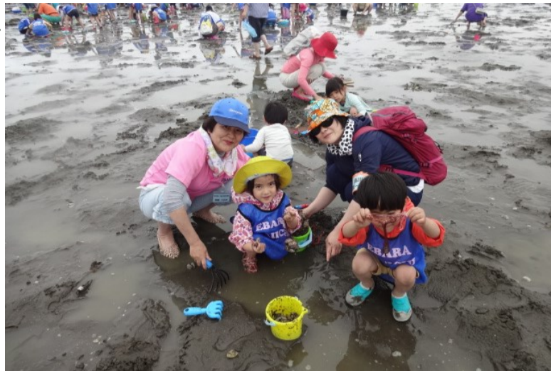
バケツいっぱい採れたよ!

今年の前日まで雨だったため、企画当日は曇りの天気になりました。朝早くから参加者91のみなさんが、獲物を