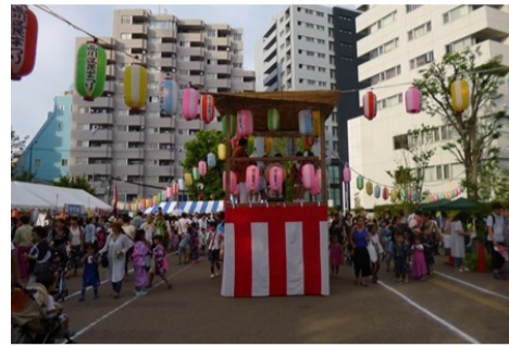
暑さ以上に賑わった区民まつりの様子

様々な模擬店が立ち並びました。焼きそばやカレーライス、クレープにフルーツポンチなど、朝から町会の皆さんが腕によりをかけた品々に、多くの人たちが行列を作りました。また、小学校PTAや中学校の生徒たちによるカキ氷やジュースなどの販売、児童センターの職員によるゲームコーナーなど、どの店にも子どもたちの楽しそうな笑顔がはじけていました。 日中の最高気温が33度を記録したこの日、スクエア荏原内イベントホールも大勢の人たちの熱気に溢れていました。 地区委員会による子どもまつりのブースでは、迫力満点のローラーコースターやキラキラ絵に射的など子どもたちは夢中になって遊んでいました。 また、ステージ発表では、この日のために練習に励んできた子どもたちが、ダンスや吹奏楽などのステージを披露し、観客から盛大な拍手が送られていました。 まつりの最後は、恒例の盆踊りで夏の夜を