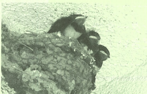
親ツバメを待つ今年孵った雛たち

私が武蔵小山駅に初めて降り立ってから65年余。当時、駅の改札は地下で、ホームは地上、緑色のかまぼこ型の2、3輛電車でした。