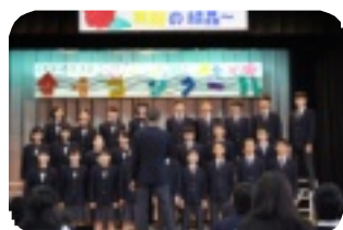
8年生合唱 「Amazing Grace」