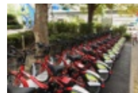
【品川水族館のサイクルポート】

そのまま返却して、水族館を満喫 返却方法は、自転車をラックに差し込み、手で鍵をかけた後、自転車操作パネルのボタンを押せば完了です。