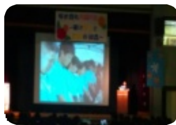
広島平和使節派遣報告