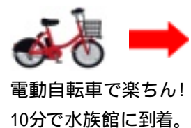
電動自転車で楽ちん！ 10分で水族館に到着。