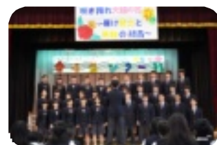
9年生合唱 「大地讃頌」