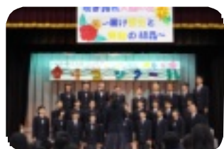
7年生合唱 「あすという日が」