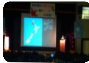
ニュージーランド研修報告