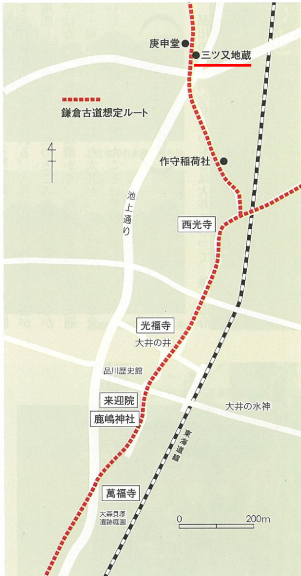
中世の寺社分布と鎌倉古道