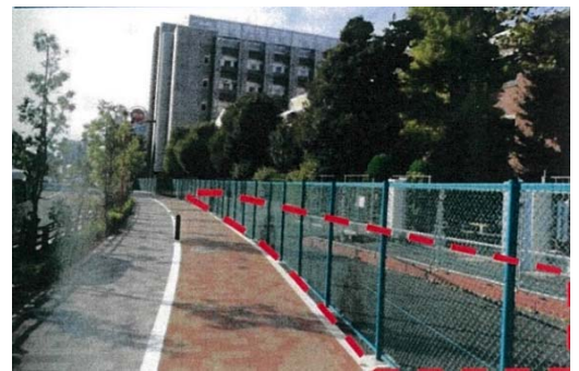
▲このような小規模な宅地が発生し、まちの賑わいが失われる心配がある

都市計画道路補助第 29 号線整備により【有効利用が困難な小規模宅地】【不整形宅地】が発生すると予想されます。これらにより商店街の分断、まちの魅力が低下する心配があり、対策が必要と考えます。また、災害に強く活気ある戸越六丁目地区にしていくため、委員会ではまちづくりのルール(地区計画)を定めることの必要性を議論しています。