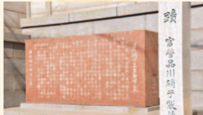
近代硝子工業発祥の碑(北品川4-11-5)

明治6(1873)年、東海寺境内に日本で最初の西洋式ガラス工場「品川興業社硝子製造所」が設立されました。3年後には政府の官営工場となり、外国人技師を招いて日用ガラス器製造を始めました。