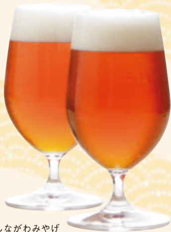
2006年に復活したしながわみやげ「品川縣麦酒」