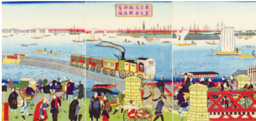
「東京高輪海岸蒸気車鉄道ノ図」(歌川広重(三代))

文明開化のシンボルともいえるのが、新橋・横浜間の鉄道開通です。明治5(1872)年の開通前から、大胆な想像による陸蒸気通行の図が出版され、当時の人々の期待と興奮がうかがえます。