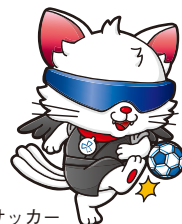
ブラインドサッカー 応援キャラクター「やたたま」

会場では、どなたでも参加できる体験コーナーや模擬店など、試合観戦とあわせてお楽しみいただけます。