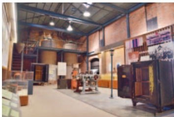
内部は資料館になっている

〒140-8715 品川区広町2-1-36 代表番号 ☎3777-1111 広報広聴課 ☎5742-6644 Fax5742-6870 http://www.city.shinagawa.tokyo.jp/