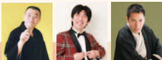
桂文治 (落語) ねづっち (漫談) 神田松之丞 (講談)