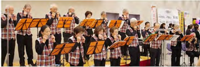
「大井ハーモニーメイツ」によるハーモニカ演奏。腹式呼吸が健康にもいいんです。