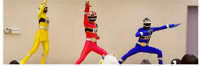
「朋優学院高等学校アトラクション部」リサイクルで地球を守る、環境戦隊エコレンジャー。