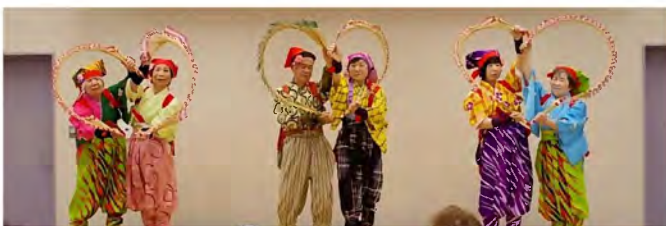
「喜楽会」の皆さんです。『アさて、アさて、さては南京玉すだれ...』