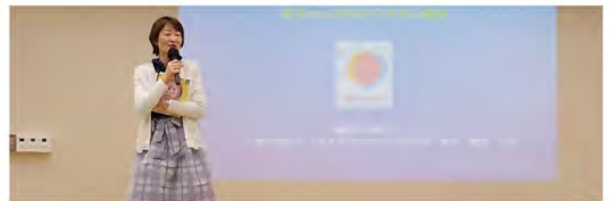
「人工聴覚情報学会」による 小児科医に聞く赤ちゃんの病気の予防。