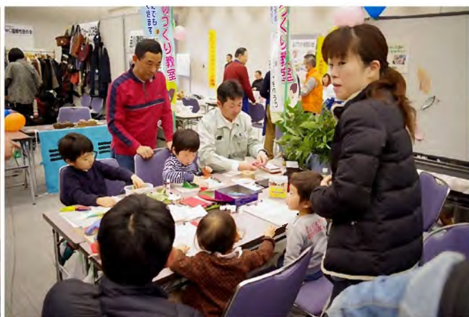
どんぐりや剪定枝を使ったものづくり教室(緑の会)

2018年2月24日(土)・25日(日)の2日間、大井町「きゅりあん」にて、『地域でつながるみんなの暮らし展 2018』が開催されました。「子育て」「介護」「ボランティア」「環境」「社会貢献」「消費生活」などさまざまな目的をもって品川区で活動するNPO法人、団体、企業