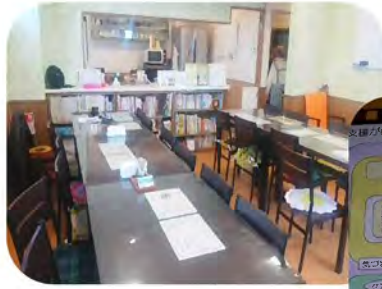
おおもり語らいの駅は、地域見守り・ささえあいの拠点の一つ

1月10日、総勢18名で大田区大森にある「おおもり語らいの駅」を訪ね、「おた高齢者見守りネットワーク(みま～も)」事業についてお話を伺いました。「みま～も」は、医療・保健・福祉分野の専門職だけでなく、民間企業、行政機関が手をつなぎ、地域の高齢者の安心・健康をテーマに活動をされています。医療・福祉・介護専門職による「支援のネットワーク」にたどり着けず「SOS」の声をあげられないでいる人達を、地域のすべての人達（隣近所、店、金融機関、配達員の方など）による「見守り支え合い(気づき)のネットワーク」と有機的に連携することで、漏れることなく支援につなげることをめざしているそうです。品川でも見守り活動をしている団体がありますが、とても参考になる事業でした。