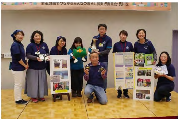
「わ！しながわ活動賞」を受賞した 山中小学校（品川コミュニティ・スクール）のみなさん