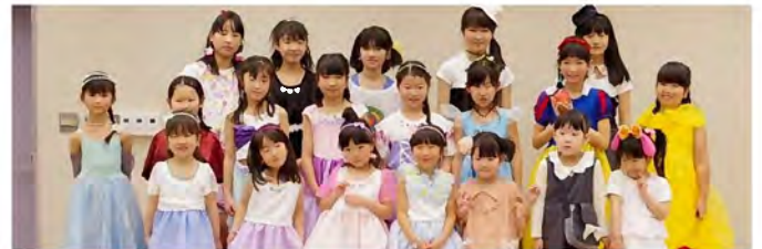
「リメママ」パパ、ママの服からリメイクで親子の絆。今日はその衣装でファッションショーです。