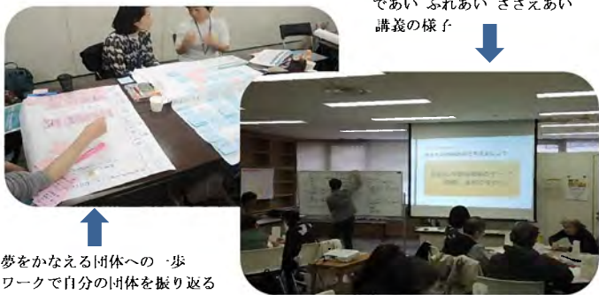
「であい ふれあい ささえあい」講義の様子

総会の参加は無料です。(総会終了後の交流会のみ実費をいただきます。) お申し込みは、品川区地域活動課協働推進係（協働ネットワークしながわ事務局）まで、お電話（5742-6605）で。