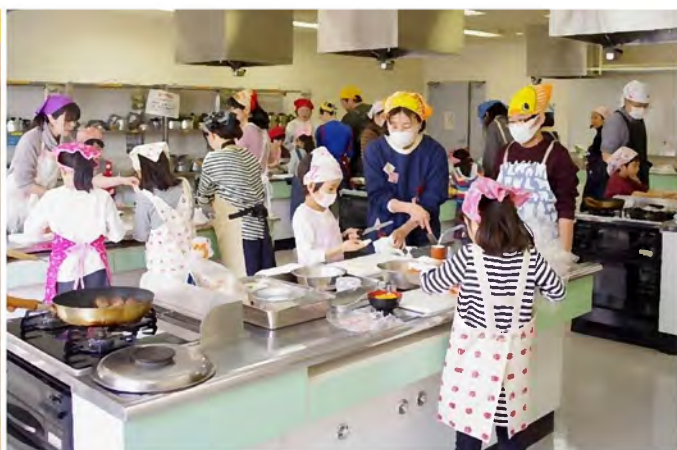
4階調理室では、親子でハンバーガーづくり…