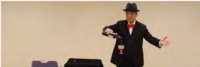
「東京奇席芸能ゆりかもめ」さまざまなレパトリーの中から、今日は手品を披露します。