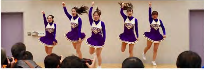
オープニングセレモニーは今年も「清泉女子大学チアリーディング部 S.S.S.」のみなさんです。