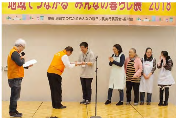
「わ！しながわ活動賞」を受賞した こども若者応援ネットワークのみなさん