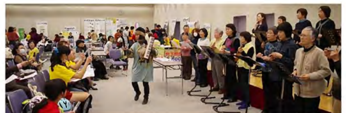
「うえるかむ楽団」来場者も一緒に参加して楽しく演奏。