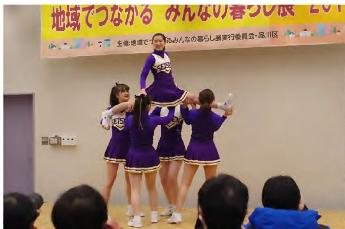
オープニングを飾った清泉女子大学 チアリーディング部 S.S.S.