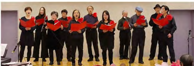
「八潮ハーモニー」活動内容の紹介に続いて、合唱をお楽しみください。