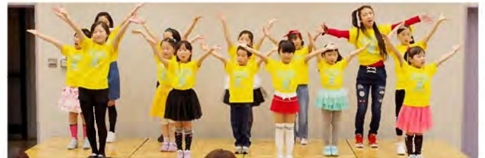
「しながわ学院エンタ部」2020 オリンピック・パラリンピックで輝く子どもたちを育てよう。ダンスと歌を披露します。