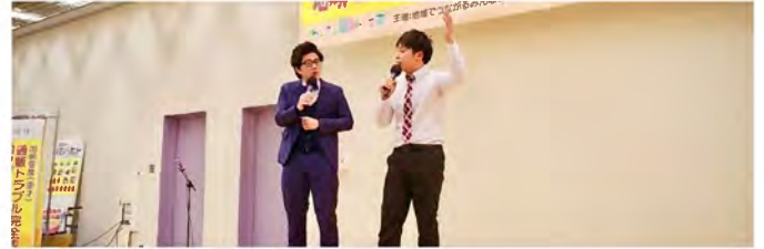
「出前奇席」漫才で通販トラブル完全攻略法を身につけましょう。