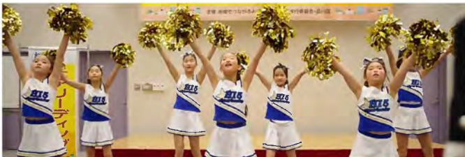
「H15(ハイファイブ)☆Cheerleader」のチアリーディング。日ごろの練習の成果を見てください。