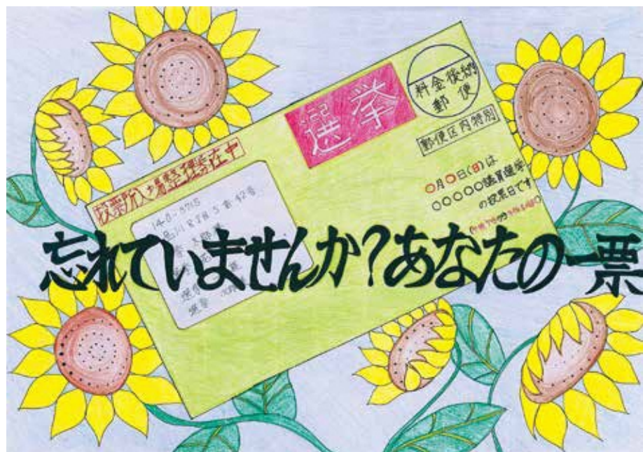
29年度明るい選挙啓発ポスターコンクール 品川区選挙管理委員会委員長賞 (中学校の部 富士見台中学校7年生)