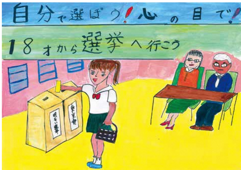
29年度明るい選挙啓発ポスターコンクール 品川区選挙管理委員会委員長賞 (小学校の部 小山台小学校5年生)