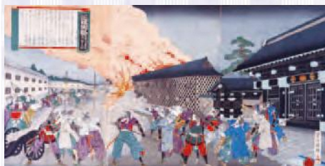
近世史略 薩州屋敷焼撃之図 (明治大学博物館所蔵)