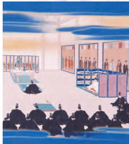
五箇条御誓文