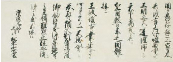
大政奉還連白書写 (高知県立高知城歴史博物館所蔵)