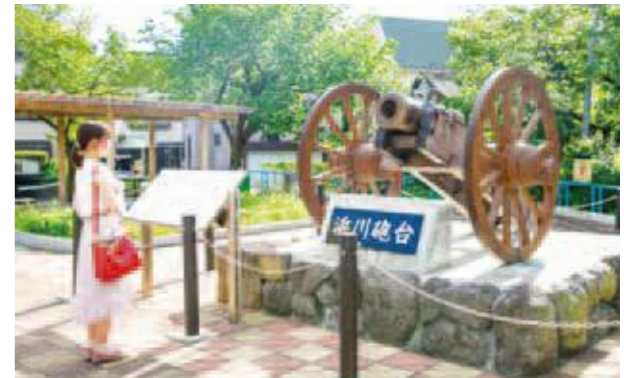
E ペリー再来航後も外国との戦争の危機は完全には去らず、土佐藩が江戸警護のため立会川河口だったこの地に砲台を設置しました。現在、近くの新浜川公園には6貫目ホーイッスル砲のレプリカが置かれています。