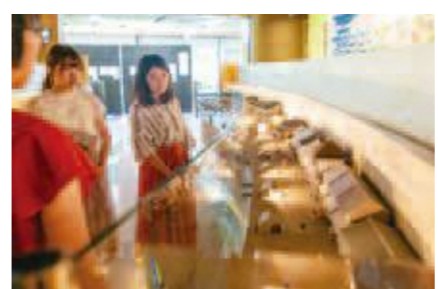
F 品川歴史館 で品川宿の模型を見ながら学芸員の方の説明を聞きました

江戸への玄関口であった品川がどのように栄えていたのか、幕末の流れの中でどのように変化していったのかを知りたいと思いました。品川歴史館で学芸員の方のお話を聞き、当時の資料や品川宿の模型を見ると、宿場がどれだけ繁栄していたのかが分かりました。また、実際に土蔵相模のあった周辺を散策してみると、道幅やお店の密集具合などから当時のまちの造りを想像できました。わたしの地元にある日光御成道の鳩ヶ谷宿同様、歩くことで様々な視点から、江戸の面影を感じられとても楽しかったです。