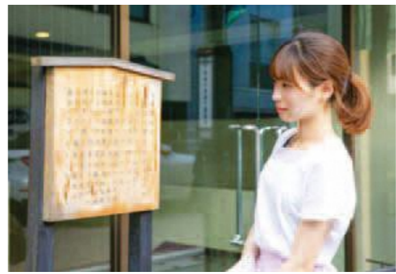
A 土蔵相模跡 品川宿にあった「相模屋」は宿有数の大きな旅籠屋で、外壁が土蔵のようなまこ壁であったため、通称「土蔵相模」と呼ばれていました。土蔵相模は高杉晋作や伊藤博文がイギリス公使館焼き討ちの密議をしていたとされる宿です。現在は案内板のみでした。

初代内閣総理大臣であり、近代国家建設に尽力した伊藤博文と品川にはどんな関係があるのを知りたいと思いました。学芸員の方に晩年を品川で過ごした明確な理由は分からないと聞いて少し残念でしたが、イギリス公使館焼き討ち事件で火付け役だったことを教わり、品川宿と深い関わりがあることを改めて知ることができました。今回は、品川宿のあった旧東海道沿いや伊藤博文の墓所を巡りましたが、機会があれば萩にある伊藤博文別邸も訪れてみたいです。