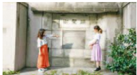
B 品川宿本陣跡（現・聖蹟公園） 江戸時代、大名や勅使が休息・宿泊する旅宿を「本陣」と言いました。本陣とは、もともと武將が戦場にいる時の本拠地をさす言葉でしたが、転じて武家の主人の宿泊場所を指すようになりました。明治元年、京都から東京に向かった明治天皇が宿泊したため、現在の公園には「聖蹟」という名前がつけられました。