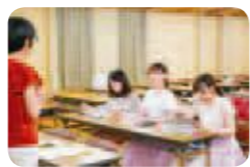
まずは品川歴史館で、品川の幕末から明治初期の歴史を勉強