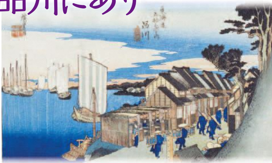
歌川広重(初代)「東海道五拾三次之内 品川 日之出」

東海道第一番目の宿“品川宿”のあった江戸時代、品川は交通の要であり、ペリー来航に始まる幕末には、歴史を動かした事件の舞台でもありました。今年は明治元年から150年にあたる節目の年。これを記念して行う品川歴史館特別展「明治維新—そのとき品川は—」で紹介する、歴史の舞台となったスポットを清泉女子大学の皆さんが巡りました。