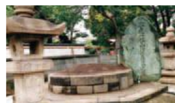
C 土佐藩主の山内豊信（容堂）の墓所 有力大名として幕末の政局に大きな影響を与えた土佐藩主。遺言によって晩年愛したこの地に葬られました。墓は円墳に墓石を配した珍しい形でした。