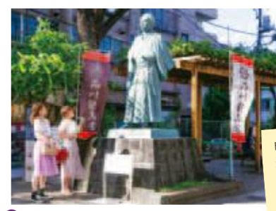
D 黒船来航時に警備のために土佐藩下屋敷に通っていたといわれている20歳の龍馬のプロンズ像です。平成22年に造立されました。実際に訪れて坂本龍馬像などを見ると、地元の方たちが、龍馬が訪れたとされることをいかに誇りに思っているか実感できました。

明治元年から150年の今年9月、区と高知県は、区内に坂本龍馬ゆかりの土佐藩下屋敷があったなど歴史的なつながりが強いことをきっかけに、連携・協力に関する協定を締結しました。今後、地域相互の強みを生かして文化や産業など様々な連携を進めていきます。