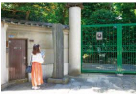
G 伊藤博文墓所 この近くに別邸があったことから国葬の後にこの地に葬られました。墓所近くには、伊藤公の名を拝借した伊藤町会、伊藤幼稚園、伊藤保育園、伊藤学園などがあります。伊藤学園の正門の門柱と門扉は、伊藤博文公宅から譲り受けたものです。墓所には普段は入ることができませんが、今年は11月2日（金）〜4日（日）に一般公開（※）されます。