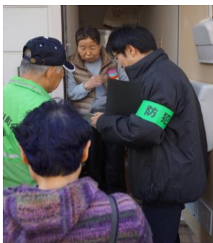
高齢者見守り活動

毎月の見回りや歳末夜警の実施、登下校時の見守りや交通安全の順守、町内の清潔を保つための清掃活動、各班に出向いての出前訓練、出初式などの防災対策、高齢者に優しい町会である“見守り・声掛け”も日常的に実行しており、子ども太鼓会も地域との交流を盛んにおこなっており、町会全体が当たり前のことを当たり前にでき、お互いが笑顔で支え合って暮らせる街を目指しております。