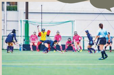
守備側は防具をつけることが許されていて、多くの選手がマスクやグローブを身につける

守備側がサークル内で反則した場合、攻撃側に「ペナルティコーナー」が与えられます。攻撃側は最大10人で攻撃できるのに対し、守備側は5人で守るため得点率が高く、試合の流れを大きく左右します。