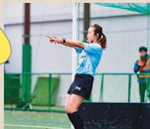
反則、プレー再開の笛を吹く審判

キック(フット)／スティック以外でボールを操作すること。 デンジャラス／膝より高い位置にボールを打つこと。ただし周辺にプレーヤーがいない場合は反則にはなりません。ボディコンタクト(接触)プレーもホッケーでは反則です。 インターフェア／相手のスティックを自分のスティックでたたくこと。 オブストラクション／ボールを隠すような行為。