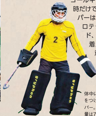
体中にプロテクター(防具)をつけてゴールを守るキーパー。プロテクターの総重量は7.5kg

フィールドに立てるのは1チーム11人。エントリーできるのはオリンピックでは16人です。選手の交代は自由で、一度に何人でも交代でき、選手交代のために時間が止まることはありません。時間が止まるのはゴールキーパーの交代の時だけです。ゴールキーパーはヘルメットやプロテクター、肘パッド、すね当てなどを着用します。その頑丈な防具は、シュートの激しさを物語っています。