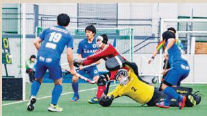
シューティングサークル内からシュートしてゴールを決める

ゴール前に「シューティングサークル」と呼ばれる半円のエリアがあり、この中から打ったシュートのみ得点となります。時間はクォーター制で、各15分×4クォーターの計60分です。