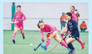
「高円宮杯ホッケー日本リーグ」で優勝した「ソニーブラビアレディース」(ピンクのユニフォーム)のプレイ

問い合わせ／スポーツ協会 (☎141-0022東五反田2-11-2 ☎3449-4400 Fax3449-4401)