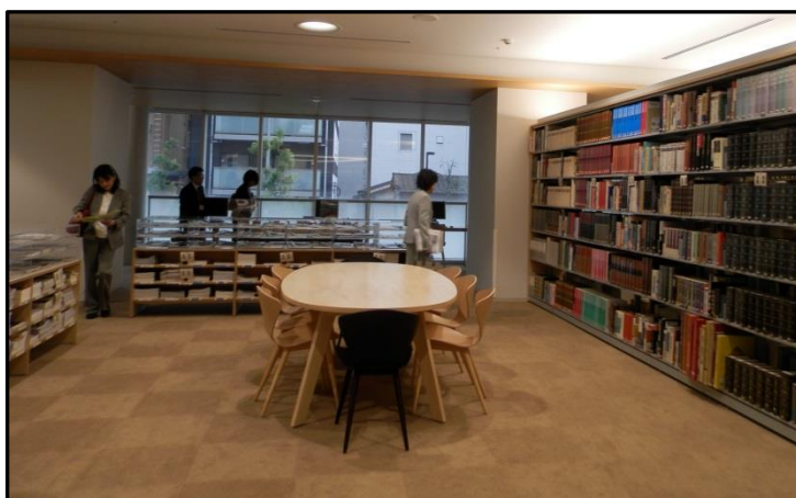
テーブルもあり、じっくりと本が読めそうです♪