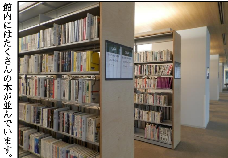
館内にはたくさんの本が並んでいます。

品川区立大崎図書館 アクセス 品川区北品川5丁目2番1号 JR大崎駅東口から 徒歩8分 御殿山小学校と隣接