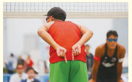
サーブする後方の味方に向かってサインを出す

エンドライン(8m)の後方フリーゾーンから打ちます。サーブは失敗してもやり直しはできません。ネットに触れて相手コートに落ちた場合は得点となります。相手チームにサーブ権が移るまで同じプレーヤーが打ち続け、サーブの順番を間違えると、反則となり相手チームの得点となります。