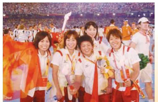
2008年北京オリンピック大会閉会式の様子