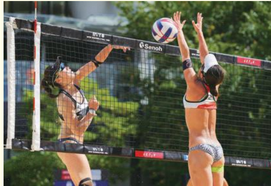
ブロックなどネット際のプレーは見どころの一つ

ネットの下から相手コートへ侵入してしまっても、相手プレーヤーに触れたり、プレーを妨げたりしていない限りは反則にはなりません。