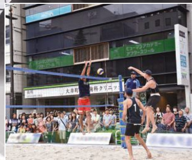
しながわビーチバレーボールフェスタの様子 (2016年9月)

(問い合わせ) オリンピック・パラリンピック準備課 (☎5742-9109 Fax5742-6585)