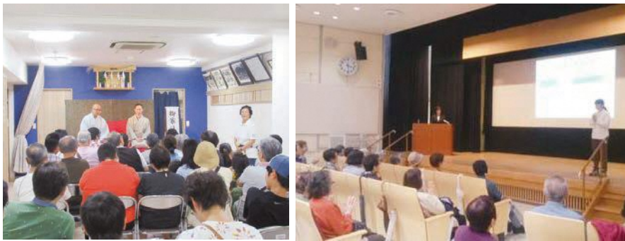
品川こども劇場 “落語コミュニケーション” (30年度) 品の輪 講演会「健康講話」(30年度)