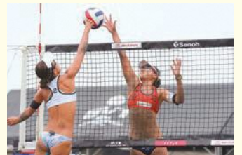
ポーキーで返球する選手

ビーチバレーボールでは指の腹を使ったフェイントは禁止されています。一方で、手の平がグーの状態や指を曲げた状態で打つポーキー、手を揃えて伸ばした状態で打つコブラショット、また、手の甲を使ってボールをコントロールするプレーは反則にはなりません。