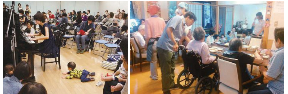
東京有閑倶楽部 育児交流サロン(30年度) けめカフェ 西大井多世代交流プロジェクト(30年度)