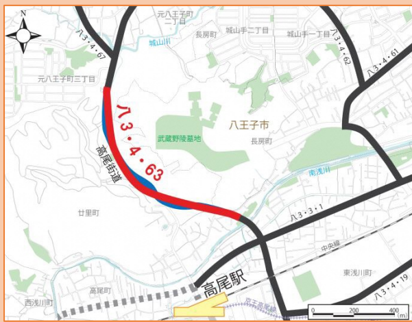
事-3 八王子3・4・63号線