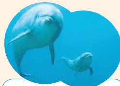
バンドウイルカのバニラが無事に出産しました。一部の場所で公開中!!

料金/1,350円(800円) 小・中学生600円(400円) 4歳～就学前300円(200円) 65歳以上1,200円(700円) ※区内在住・在勤・在学の方は各自、住所など確認のできるものの提示で( )の料金になります(まもるっこの提示可)。 ※イルカの出産に伴い、イルカショーなどを中止しています。