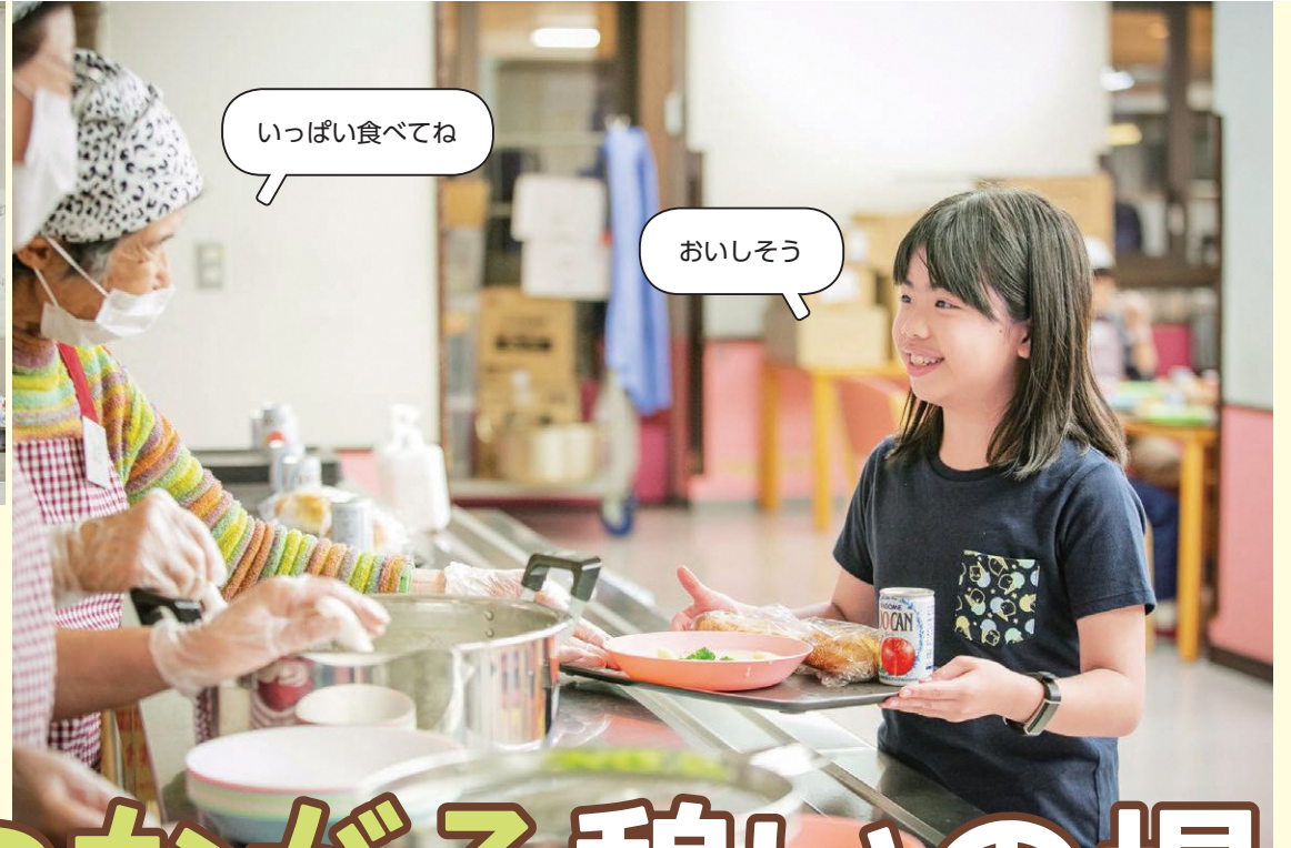
食事は地元町会の東親会婦人部の皆さんの手作り