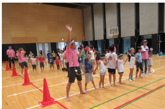
チームみんなで手を繋いでハワイアンリレー

開会式と準備体操を行い、いよいよゲームがスタートしました。今年の種目は、『今年に引き続き』『ハワイアンリレー』『ヘイカモン』、そして新種目の『風船運び』『オセロ』を加えた4種目です。