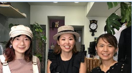
のぞみ店長(中央)と講師の先生方

★大好きなモノのリレー★ 2019年6月頃、ひよんなことからのぞみ店長の大好きな多肉植物の寄せ植えと誰かの大好きなモノとを交換していくリレーという企画を始めました。約1ヶ月経ったある日、多肉植物の寄せ植えは白いくまのぬいぐるみに変わりました。物々交換の相手はMさんで、とても大切にしていたものだったそうです。この企画に興味があり交換することにしたぞ。先日、テレビ番組「モヤモヤさま〜す2」でも取り上げられました。ただの物々交換ではありません。あくまでも大好きなモノ同士の交換リレーなのです。次回、くまのぬいぐるみは何に変わっていくのか、これから楽しみます。