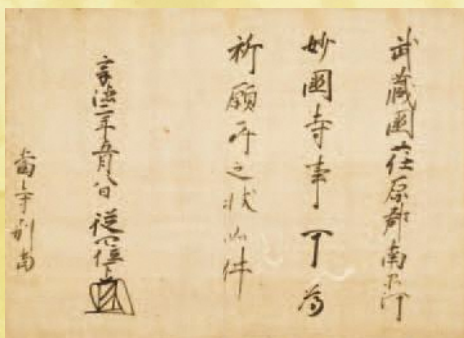
修復後初公開 東京都指定文化財 「鎌倉公方足利成氏御教書」 (天妙国寺所蔵・当館寄託) 展示期間/10月6日(日)～11月4日(休)

南品川の妙国寺(現・天妙国寺)を中心に、中世から近世にかけての品川の歴史を紹介します。