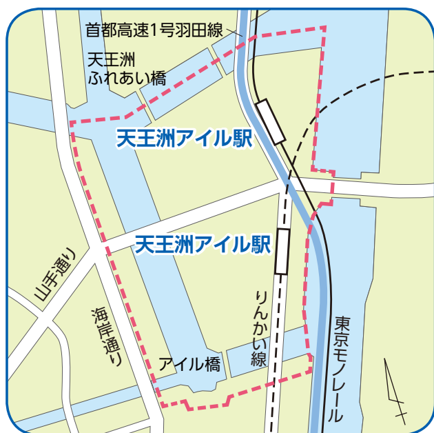
天王洲地区の範囲