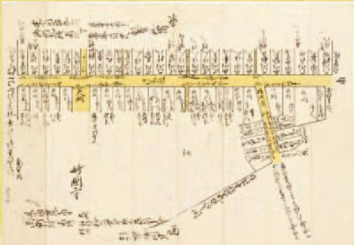
妙国寺門前明細絵図 (南品川宿名主利田家文書・立正大学所蔵)

展示期間/10月6日(日)～11月4日(休) (11月6日(火)～12月1日(日)は複製展示)