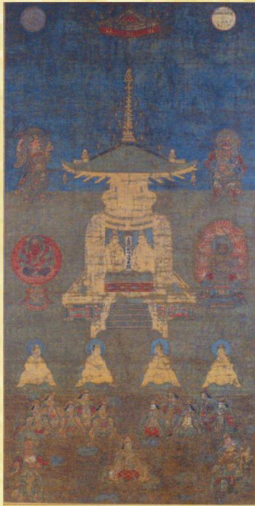
品川区指定文化財「宝塔絵曼荼羅」 (天妙国寺所蔵・当館寄託) 修復後初公開

展示期間/10月6日(日)～11月4日(休) (11月6日(火)～12月1日(日)は複製展示)