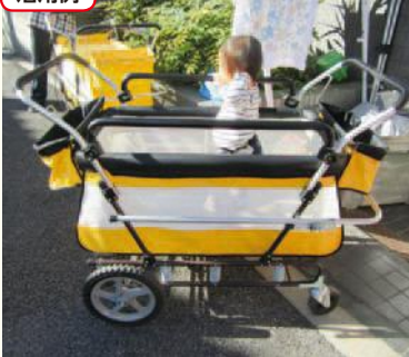
保育園で使用するお散歩カーの購入

問い合わせ／福祉計画課地域包括ケア推進係 (☎5742-6914 Fax5742-6797)