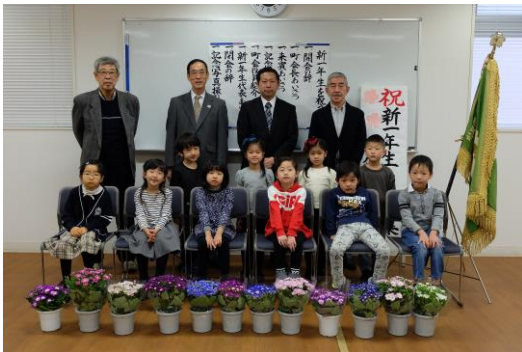
新入学児童の集い