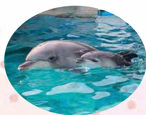
元気に泳ぐイルカの赤ちゃん