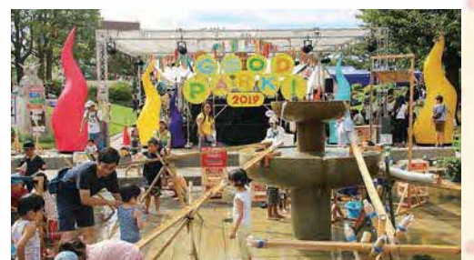
GOOD PARK! 2019