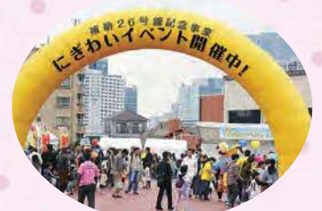
にぎわいイベント