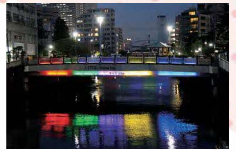
橋梁をオリンピックカラーにライトアップ