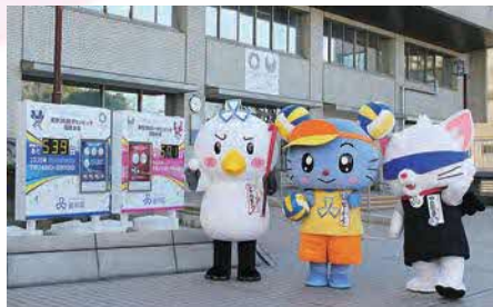
カウントダウンボード