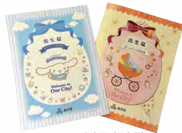
オリジナル出生届(記念用)

©2001, 2019 SANRIO CO., LTD. APPROVAL NO. G603346