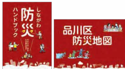
「しながわ防災ハンドブック」と「品川区防災地図」