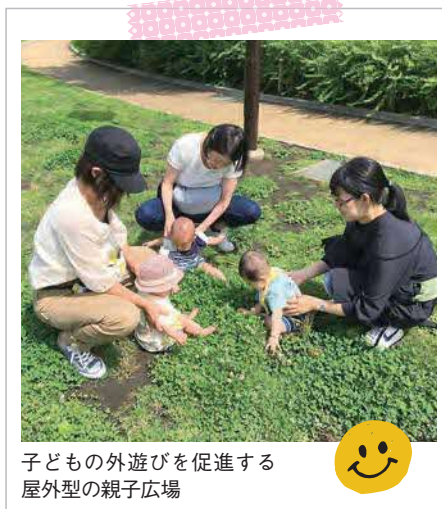
子どもの外遊びを促進する 屋外型の親子広場