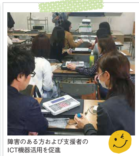
障害のある方および支援者の ICT機器活用を促進