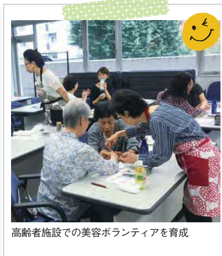
高齢者施設での美容ボランティアを育成