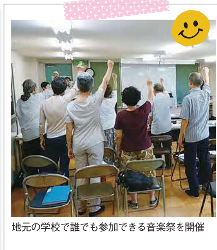
地元の学校で誰でも参加できる音楽祭を開催