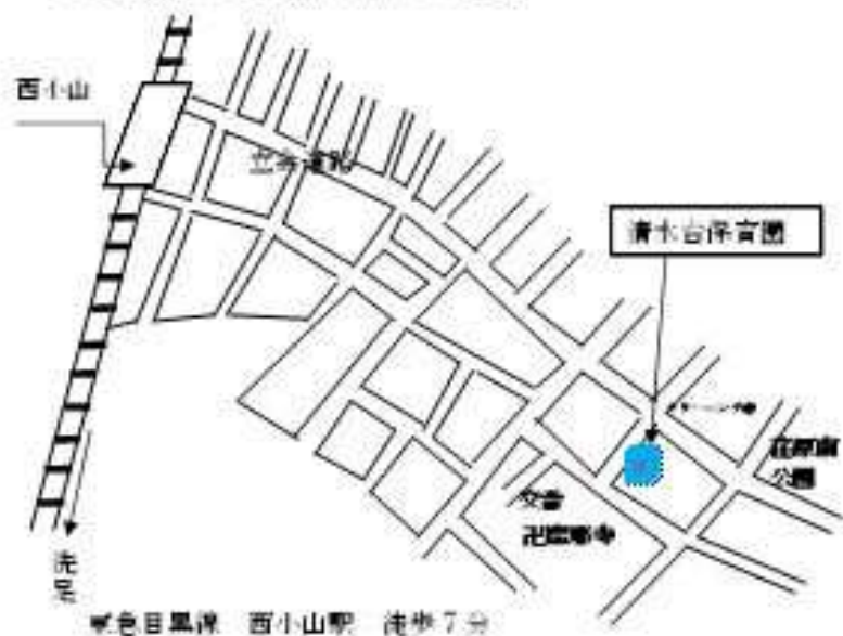
◆交通機関および最寄り駅からの地図