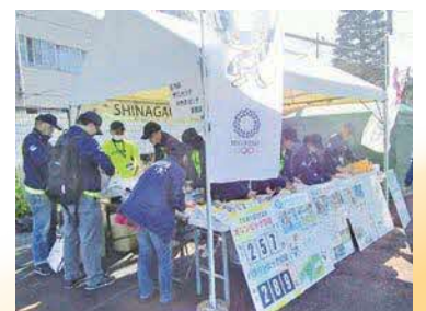
イベント運営の手伝いをする「しな助」の皆さん

ボランティア活動を通じてスポーツに親しみ、地域のスポーツ活動に尽力している「しな助」の皆さん。7月に東京2020大会をひかえ、ますます活動に熱が入ります。