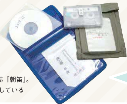
朝笛が発行している声の雑誌「朝笛」。約90人の利用者に毎月郵送している

ボランティアで行っていることですが、努力によって自分の技術があがっていくことに喜びを感じています。また物として残るので「より良い物を作ろう」という意欲がわいてきて、そこが音訳にはまった点でしょうか。音訳自体は一人の作業ですが、「朝笛」では声の雑誌の発行や、雑誌をお送りしている聴読者の方々との交流会などみんなで取り組むことも多く、そんな時はおしゃべりに花が咲いたりして楽しく活動しています。