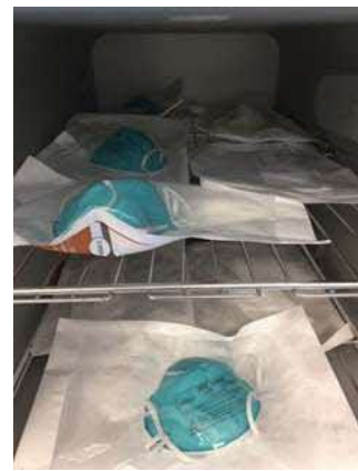
図 2：ロード用の N95 マスクの包装と棚への積載例