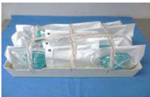
図 1：ロード用の N95 マスクの包装とトレイへの積載例