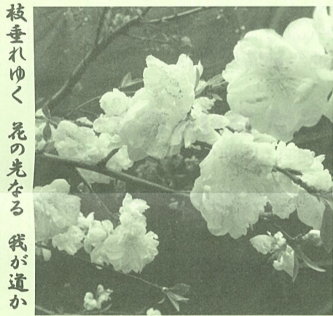
枝垂れ桜の先を覗くと、花の光る道が

私事ですが、毎年駒込にある公園まで見に行きます。しかし、探せば近所の公園にもありますし、