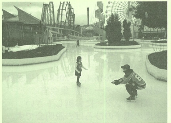
初めてのスケート体験でハラハラドキドキ!

富士急ハイランドまでの道中では、地区委員が考えたレクリエーションで楽しみました。まずは全員へ自己紹介し、その後はクイズを通してバスの中は大盛り上がり。バスは無事に富士急ハイランドへ到着するも、外はあいにくの雨。メインであったスケートを実施するには危険な状況で、とても残念でしたが遊園地のアトラクションを楽しむ企画に変更となりました。しかし迫力満点のアトラクションで親子で楽しい時間を過ごすことができました。毎年冬の企画に同行して頂いているアイスホッケーチームのフォックスさんが今年も参加してくださりました。子どもたちの思いが空に届いたのか、お昼に近づくにつれて雨が上がり空も明るくなってきました。そのタイミングを見計らって数名の子どもたちがリンクの中へ。初めて滑る子はフォックスさんと手を繋ぎながら恐る恐る滑ります。何周か滑ると次第に手を放しても滑れるように。表情は緊張していましたが確実に上達しています。少しの間でしたがフォックスさんとのスケートを楽しむことができました。あつという間に終了時間となり、名残惜しい気持ちを抑え帰路につきました。あいにくのお天気でスケートが思う存分できなかったのが心残りとなつてしまいましたが、また来年も冬の楽しい企画を考えていきたいと思えます。参加された親子の皆様、同行して子どもたちの安全を見守り真心のこもった事業を企画してくださった地区委員の皆様、ありがとうございました。(事務局)