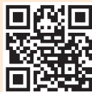
マギーズ東京 はこちらから