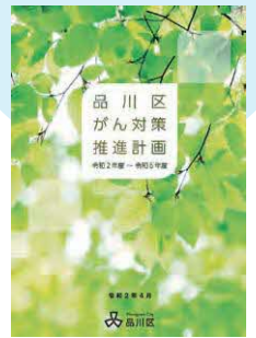
品川区がん対策推進計画 表紙

～がんからあなたを守りたい～ がんにならない、がんとともに 自分らしく暮らせるまち品川