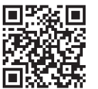
こちらからも ご覧になれます

※詳しくは東京産業保健総合支援センターホームページ https://www.tokyos.johas.go.jp/ をご覧ください。