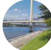
(左) 目黒川コースの到着は五反田リバーステーション (中) 船上からの天王洲アイルの夜景 (右) 爽やかな京浜運河緑道公園の運河の風景

目黒川または天王洲運河を巡るショートクルーズです。水上から新旧織り成すしながわの街並みを満喫できます。