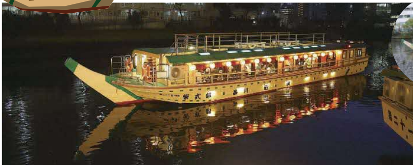
趣のある提灯が灯された屋形船に乗って非日常感を味わえます