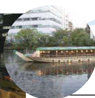
貸切船であれば屋間の景色を楽しめます