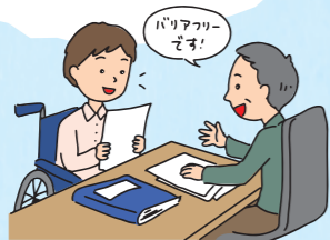
障害のある人の求めに応じて、バリアフリー対応物件を探すなど適切に対応する。