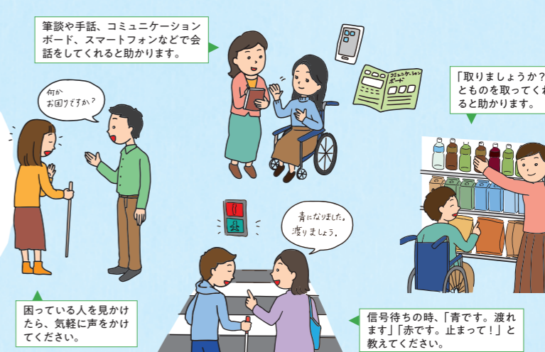
筆談や手話、コミュニケーションボード、スマートフォンなどで会話をしてくれと助かります。

困っている人を見かけたら、声をかけ、本人の意思を確認しながら、必要なサポートをしましょう。あなたのちょっとした声かけや行動で助かる人がたくさんいます。まずは「何かお困りですか?」「何かお手伝いしましょうか?」と尋ねてください。