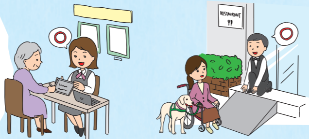
筆談やタブレットなどを用いて、障害のある人の希望を聞きとり、わかりやすく内容を説明する。

・差別解消法では、民間事業者は努力義務とされていますが、平成30年10月に施行された都条例(東京都障害者への理解促進及び差別解消の推進に関する条例)では、差別解消の取り組みを一層進めるため、義務化されました。