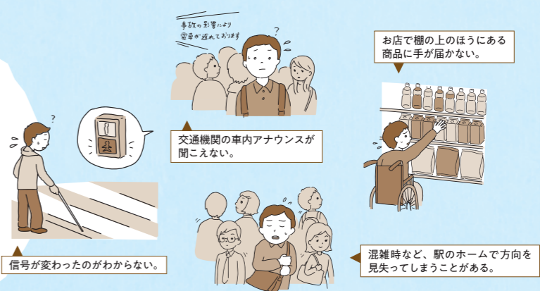
信号が変わったのがわからない。