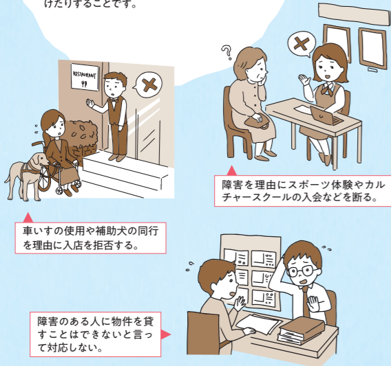
車いすの使用や補助犬の同行を理由に入店を拒否する。

障害のある人に対して、正当な理由なく、障害を理由として、サービスの提供を拒否したり、制限したり、障害のない人にはつけない条件をつけたりすることです。