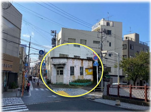
江戸の昔より先祖代々品川っ子！

現在から40〜50年前には交通安全協会の事務所になり、20年ほど前からは櫻心会町会が借り受け、交通安全運動の拠点となり備品置き場等として活用しています。