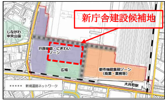
現在の庁舎の東側、スポル品川大井町の北側です。