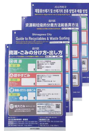
「資源・ごみの分け方・出し方」冊子