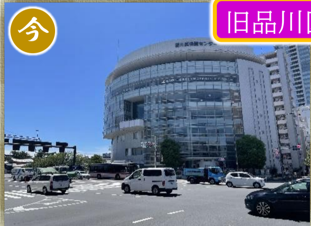
▲聖火ランナーが通過した旧品川区役所の跡地には、現在、品川区保健センターが建っています。