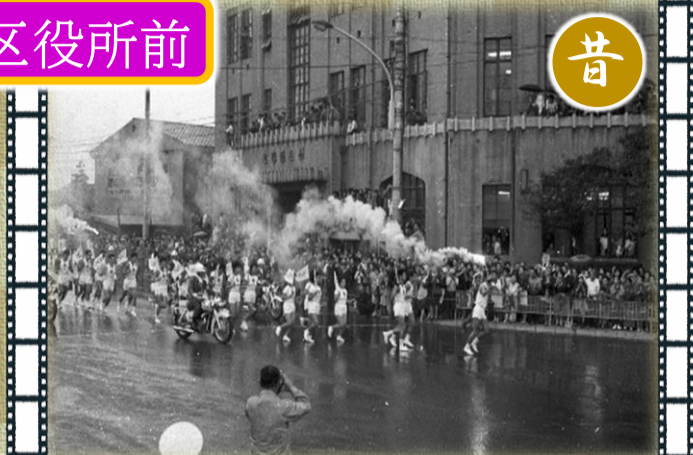
▲当時の聖火ランナーは、大田区から第一京浜国道を北上し、北品川の旧品川区役所前を通過して大崎方面へ駆け抜けました。