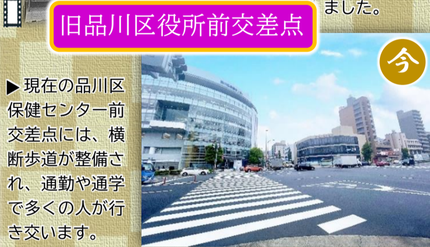
▶現在の品川区保健センター前交差点には、横断歩道が整備され、通勤や通学で多くの人が行き交います。

7月23日(金・祝)から8月8日(日)まで、東京2020オリンピックが開催されました。 東京でのオリンピック開催は、1964年の東京大会以来、実に57年ぶりとなります。 そこで、東京2020オリンピックの開催を記念し、前回の東京大会においてオリンピックムードに包まれた品川第一地区管内のスポットを、今の風景とともにいくつか紹介します。 57年前の場所は、果たして今どうなっているのか。当時の様子を知る方も知らない方も、今昔の写真を比べ、時の移ろいを感じてみませんか？