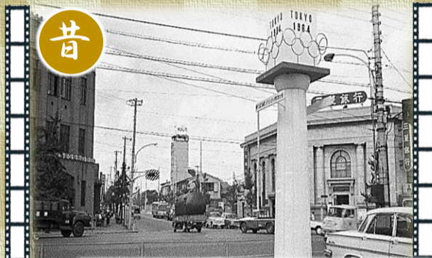
◀旧品川区役所前の交差点には、オリンピックの開催を記念して、五輪のマークが付いた歓迎塔が建てられました。