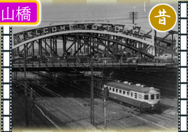
▲当時の八ツ山橋は、アーチ形の鉄橋で、オリンピックに合わせて「WELCOME TO TOKYO」の文字が入っていました。