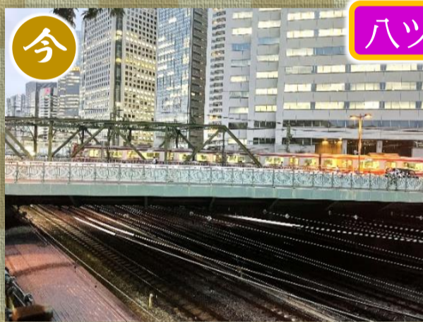
▲周囲に高層ビルが立ち並び、現在の八ツ山橋の様子。アーチは無くなりましたが、欄干が当時の面影を感じさせます。