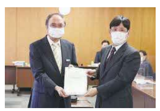
「品川区新庁舎整備基本構想」を 区長へ答申