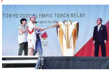
東京2020オリンピック聖火リレー点火セレモニー (しながわ中央公園)