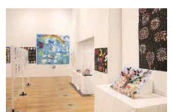
「障害者作品展」開催