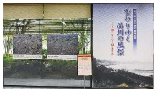
品川歴史館特別展「変わりゆく品川の風景」開催