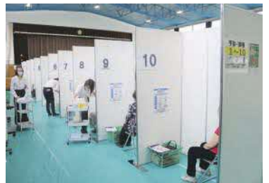
区内集団接種会場での ワクチン接種