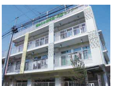
南ゆたか児童センター・ 南ゆたか保育園