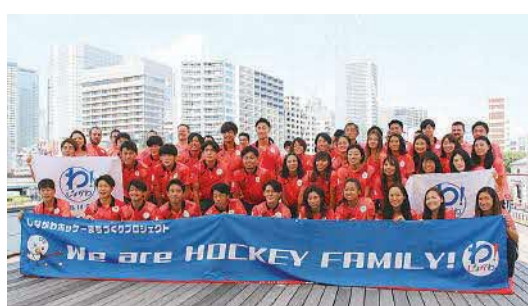
ホッケー日本代表選手団が区へ感謝の訪問