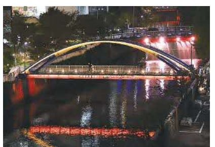
区内橋梁のライトアップ再開