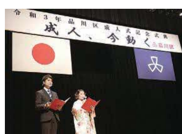
令和3年成人式記念式典 オンライン開催