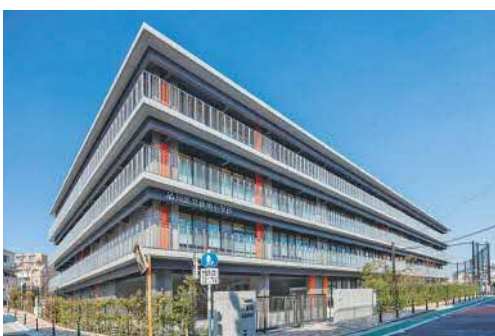
後地小学校新校舎