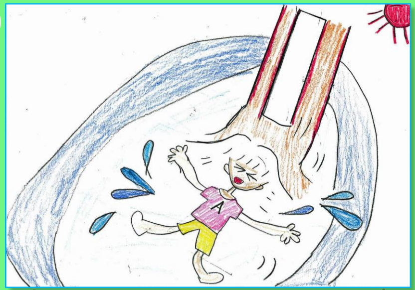
イラスト くらりんぶる コンビニで前に並んでた おじさんと店員の会話

プールで楽しんでいる様子がひと目で伝わってきます。女の子の表情が元気いっぱいいいですね！スライダーを降りてきた様子かな？水しぶきの表現もいい感じです。この調子でたくさん楽しんで描いてってね！ 【五十嵐】