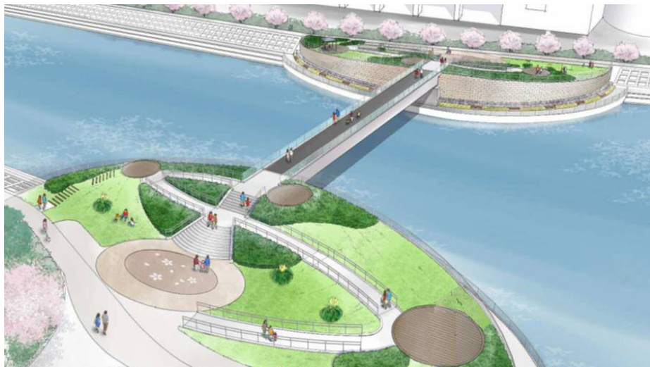
人道橋イメージ図