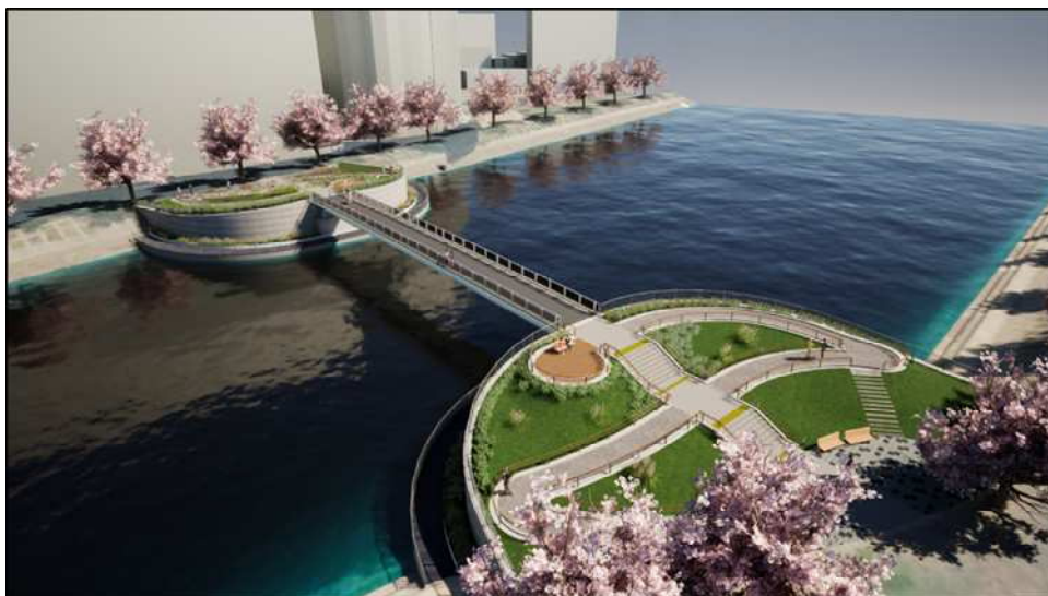
人道橋イメージ図